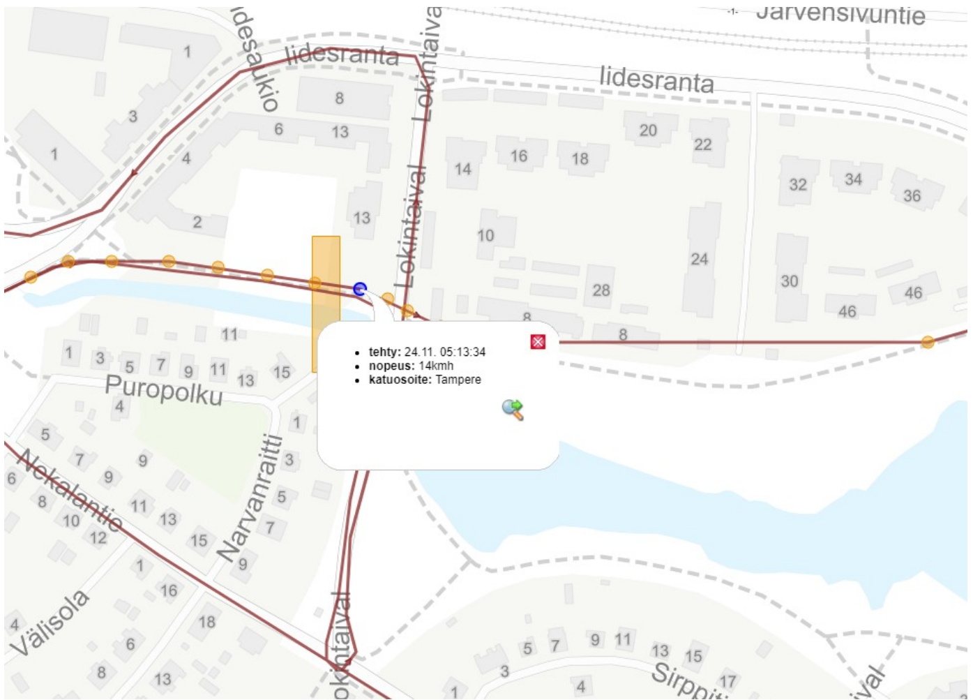
Liite 3 Liukkaudentorjunta 24.11.2021 n. klo 5:13